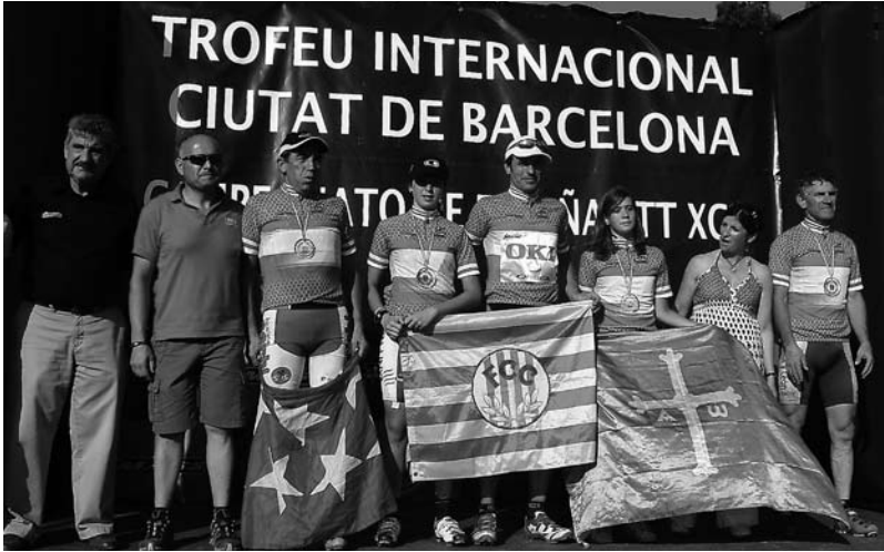
No mes de xullo do ano 2010 acada o título de campión de España de BTT en Montjuich, Barcelona.

En 2011 proclámase campión de España de BTT máster 60 na localidade madrileña de Becerril de la Sierra o día 16 de xullo