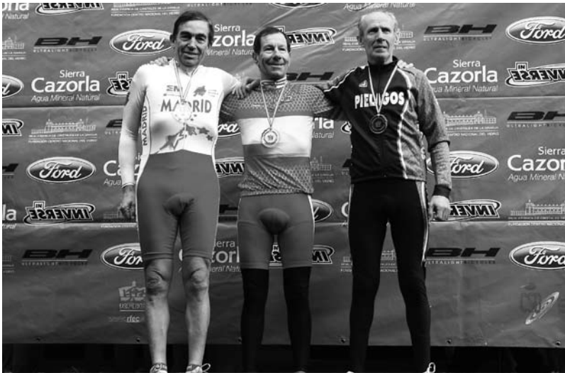
O oito de xaneiro do ano 2011 queda de segundo no Campionato de España de ciclocrós máster 60 en Zamora.