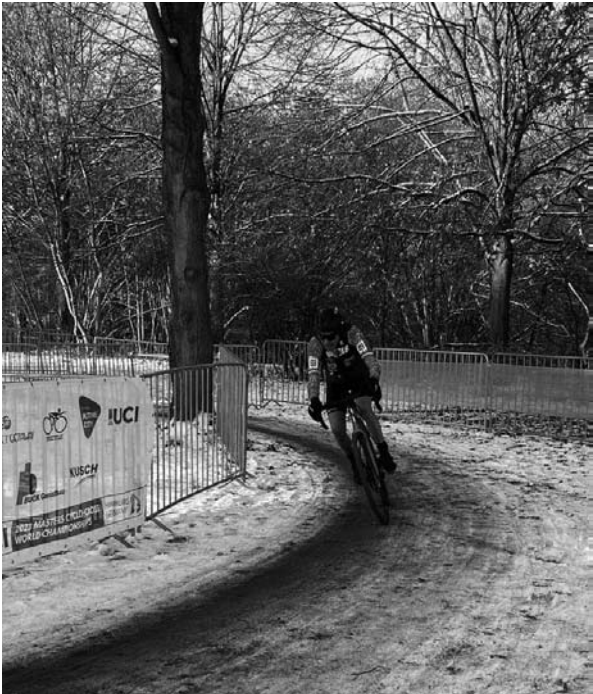
No ano 2023 en Hamburgo, Alemaña, loitando contra o frío, o xeo e a neve no Campionato do Mundo de ciclocrós.