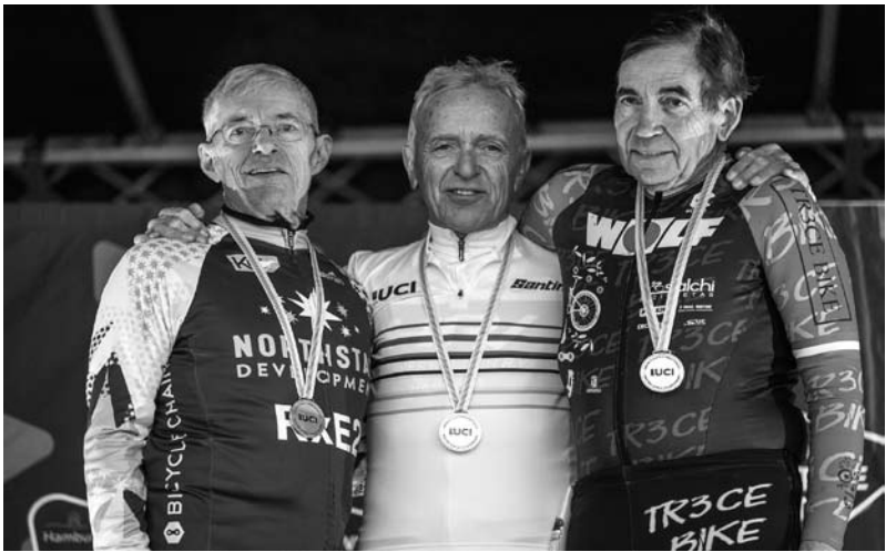
Contento e feliz, despois de lograr a medalla de bronce no Campionato do Mundo en Hamburgo.