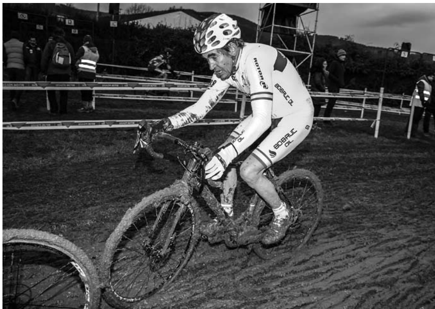
No Campionato de España de ciclocrós 2017, máster 65, celebrado en Legazpi, Simaes obtén a medalla de prata despois de loitar contra o barro.