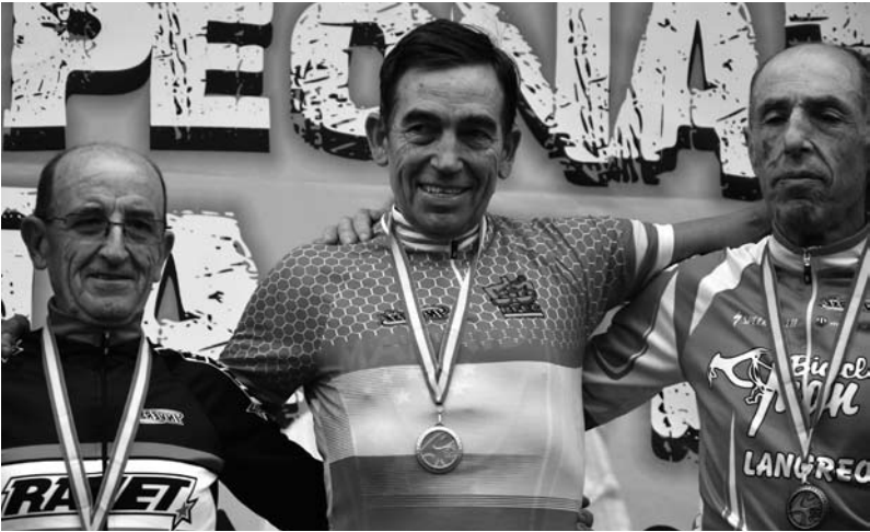
Para non variar, en 2014, Simaes tamén venceu en BTT na localidade oscense de Panticosa.