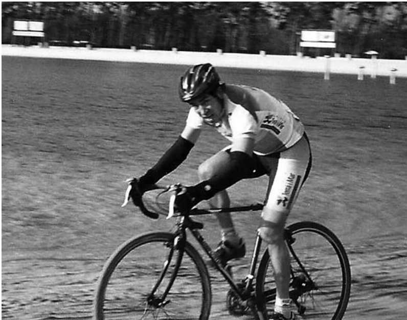
No ano 2002 disputando, co lago Zilvermeer de fondo, O Campionato do Mundo de ciclocrós na cidade belga de Mol.