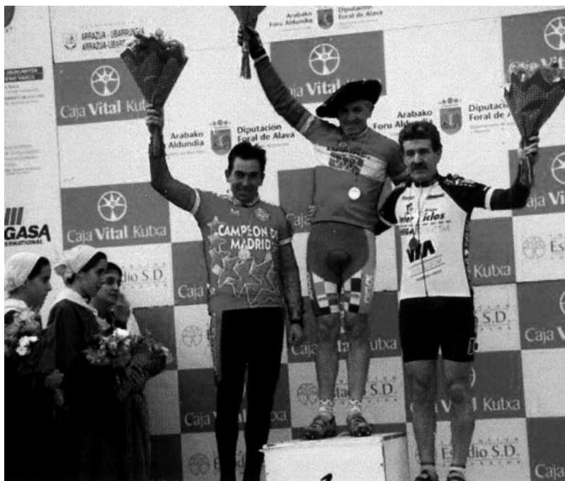
En 2001 volve ao ciclocrós, e sobe ao podio como segundo clasificado no Campionato de España na categoría de máster 50 na localidade alavesa de Durana.

ciclista que tan ben se lle dera na primeira parte da súa etapa deportiva, e sobe ao podio como segundo clasificado e medalla de prata no Campionato de España na categoría de máster 50 na localidade alavesa de Durana.