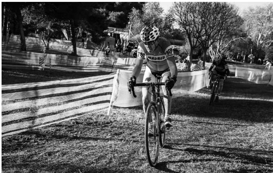
Remontando, no ano 2016, ao segundo clasificado no Campionato de España de ciclocrós celebrado en Valencia.