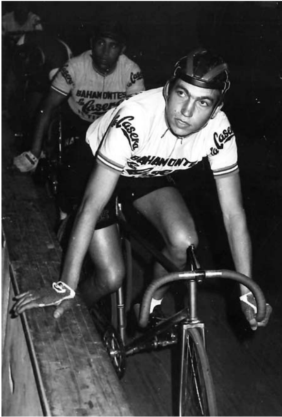
En 1971 queda subcampión por equipos no mesmo campionato e escenario.

tócalle Melilla. Atrás deixa no andar madrileño da súa tía Carmen, coa que xa vivía había un tempo, a súa noiva de aceiro aparcada e garda a súa noiva de carne e sentimentos no seu pensamento de home namorado. Coa primeira se reencontrará despois de 23 ou 24 anos e á segunda abrázaa en canto pode. A estancia no exército depáralle, como era de esperar, novidades importantes. Empeza a fumar e a engordar. Para máis inri tócalle estar na cociña e come tanto que ten que tirar a roupa que antes lle servía.