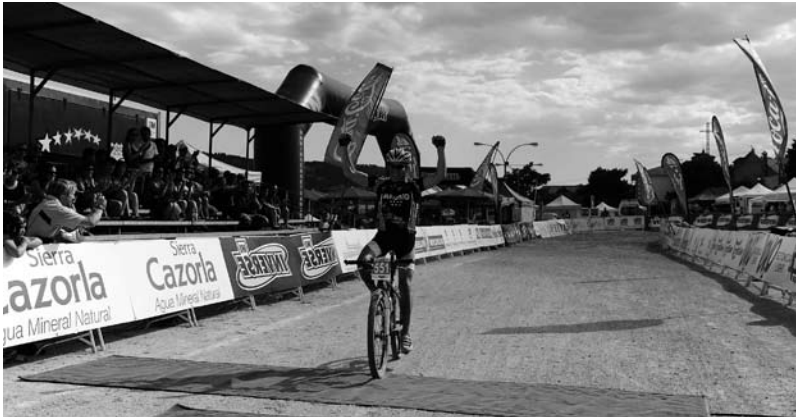
Vencedor no ano 2011, como campión de España de BTT, máster 60, en Becerril de la Sierra, Madrid.