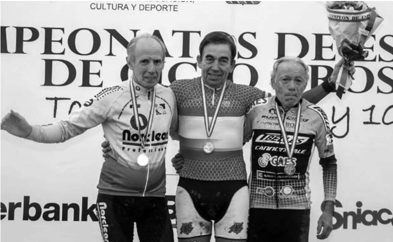
No ano 2015 no máis alto do podio coa camiseta de campión de España máster 65 de ciclocrós en Torrelavega.

de segundo o ano seguinte, 2017, na localidade guipuscoana de Legazpi, nunha carreira na que o seu peor rival foi o barro.