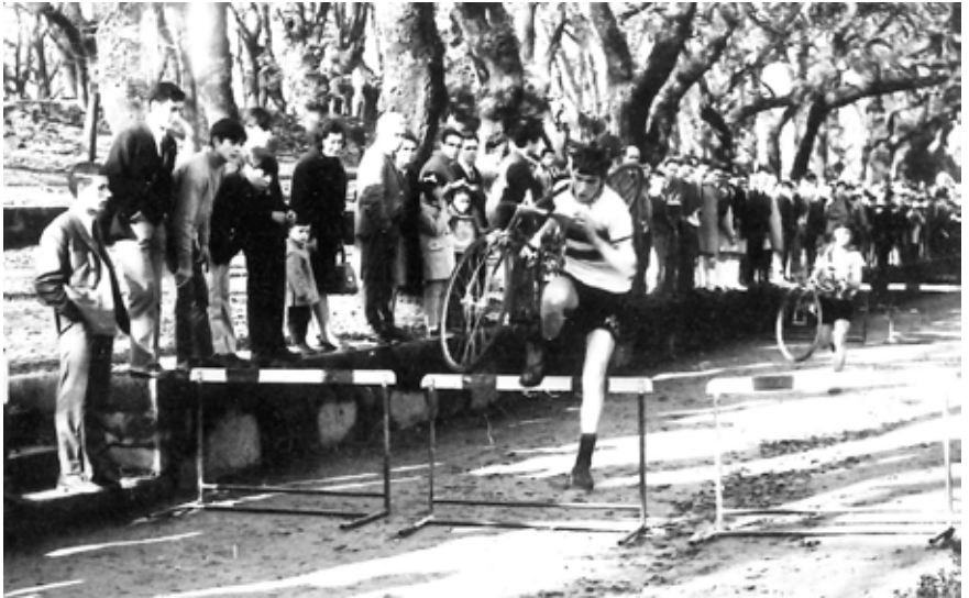
Saltando a valla no paseo da Ferradura.

rada da monumental e incomparable catedral compostelá, depáralle o terceiro posto na liña de chegada baixo os centenarios carballos da formidable carballeira de Santa Susana.