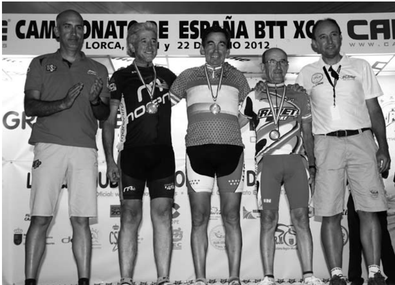
Campión de España BTT en Lorca, Murcia, ano 2012.

nunha xornada de calor abafante. O ano seguinte volve conseguir este título na localidade murciana de Lorca, que repite en 2014 en Panticosa, Huesca. En 2015 volve subir ao podio, esta vez como campión de España máster 65 de ciclocrós, na localidade cántabra de Torrelavega, triunfo que repite no ano 2016 en Valencia, quedando